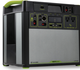
Batería portátil de reserva

Reciba gratis una batería de reserva con una fuente de energía limpia que le permitirá usar su dispositivo médico durante un corte de energía.