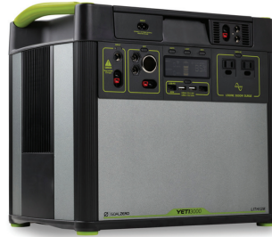
Portable Backup Battery

Get a free , clean-energy backup battery to operate your medical device during an outage.